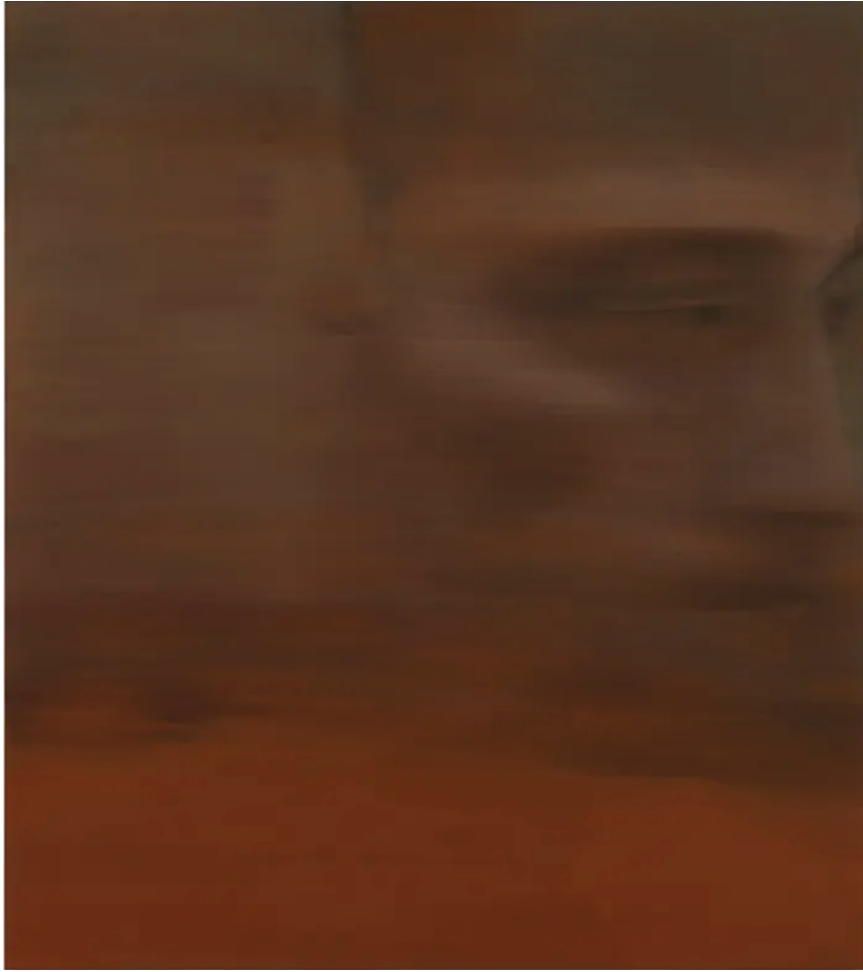
Two officials oversee Chernobyl's catastrophe, 2025 Huile sur toile 130 x 115 cm

« C'est comme si l'effacement était la seule façon de lutter contre l'oubli affectif que peut générer l'histoire : on tend vers l'abstraction, mais quelque chose résiste. Un visage. »