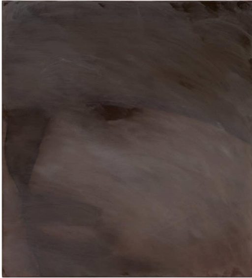
Invasion de la Finlande, 1939 Prisonnier Russe, 2025 Huile sur toile 75 x 68 cm

« Je ne peux pas peindre les oppresseurs ou les opprimés de manière neutre. On ne peint pas un prisonnier nazi comme n'importe quel autre sujet. Le noir et blanc est un geste. Le traitement statuaire, symétrique des traits, par exemple. Il y a aussi une notion de respect dans le fait d'indiquer ce qu'on regarde et d'où ça vient. Mes titres sont souvent très descriptifs, scientifiques : « Prisonnier russe en 1944 ». Ce sont des images très sérieuses. C'est d'une certaine manière une façon de répondre aux événements géopolitiques d'aujourd'hui, et ainsi tenter d'éviter que l'histoire se répète. »